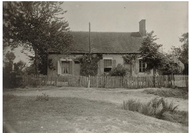
Maison de Maurice Rollinat à Fresselines (23)