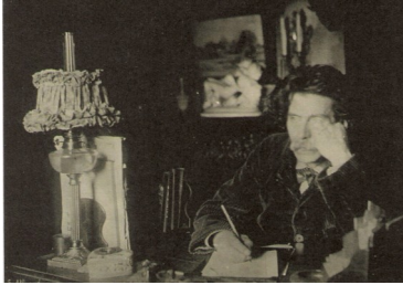
Maurice Rollinat à sa table de travail en 1898 par Eugène Alluaud