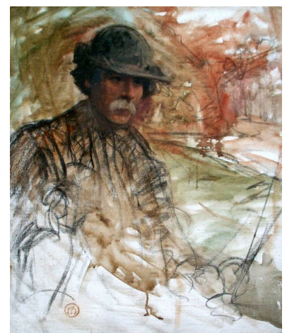
Portrait de Maurice Rollinat par Fernand Maillaud - Crédit photo : Musée de Guéret©

D'autre part, sa femme Marie Sérullaz, qu'il avait épousée à Lyon en 1878, le quitta définitivement, lui reprochant principalement ses fréquentations. Malade, fatigué, et refusant d'être transformé en institution littéraire, Rollinat décida de quitter Paris le 11 septembre 1883, accompagné d'une actrice, Cécile de Gournay. Il s'installa alors dans une petite maison près de Fresselines