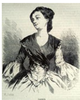
Consuelo - Photolouis - musée et bibliothèque © - Ville de La Châtre